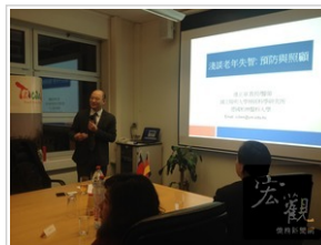
正在德國柏林醫科大學訪問研究的陽明大學神經科學所教授連正章（立者）在健康講座主講「淺談老年失智：預防與照顧」。